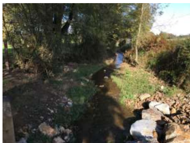
Renaturation de l'Ouette à NUILLE SUR OUETTE