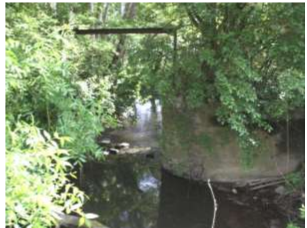
Moulins (=3) - Souvray à BAZOUGERS - Hune à BAZOUGERS - Petit Bozée à ?