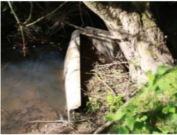
Seuils sauvages (= 5)