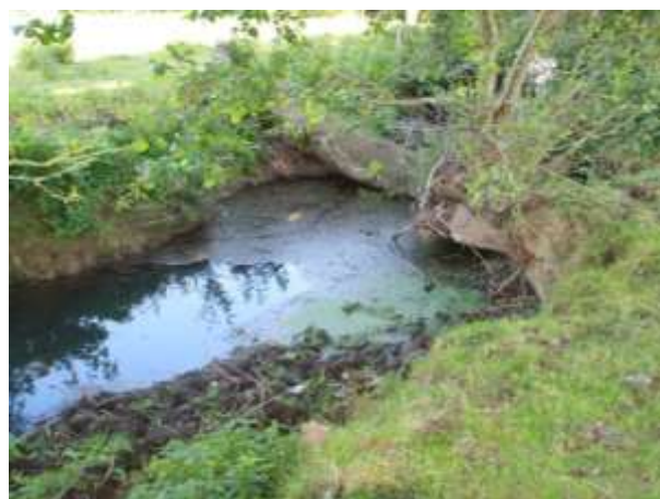
Embâcles (À définir)