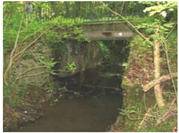
Pont à rendre franchissable (=4)