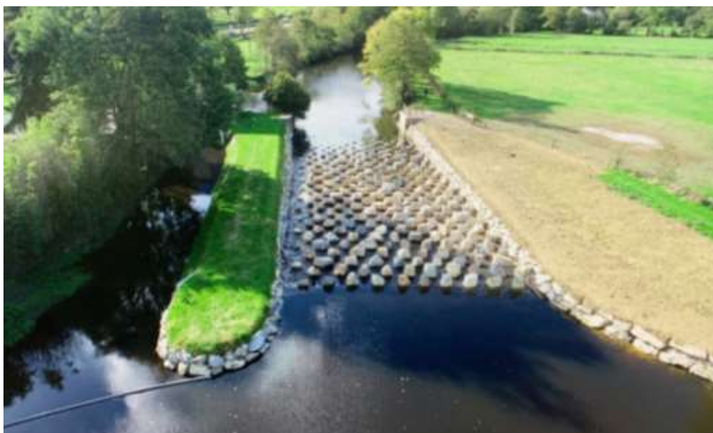
Aménagement du Moulin Neuf à ARGENTRE