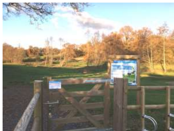
Aménagement de la zone humide de la Collerais au BOURGNEUF LA FORET