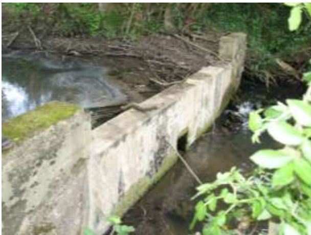
Ouvrages hydrauliques illégaux (=1)