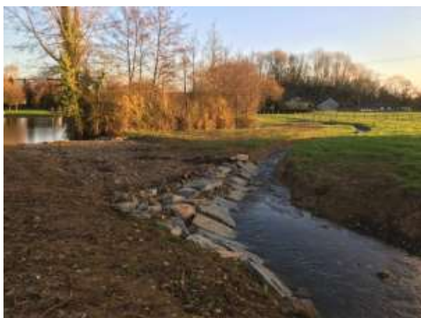
Contournement du plan d'eau de Morfelon au BOURGNEUF LA FORET