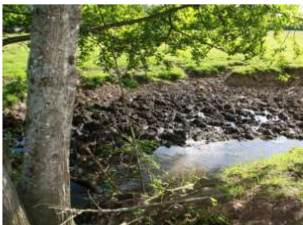
Abreuvoirs sauvages > 20 (restauration du lit) Absence clôtures > 1 km (charge propriétaires)